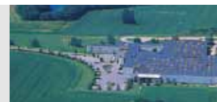
Høje Taastrup, Denmark