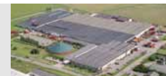
Nørre Alslev, Denmark